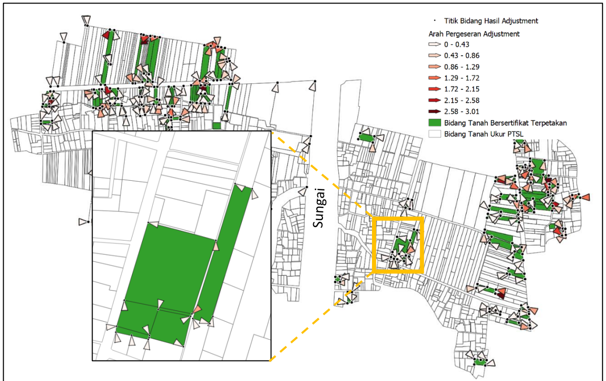
Gambar 3. Pergeseran Arah Batas Bidang Tanah Bersertifikat Terpetakan.