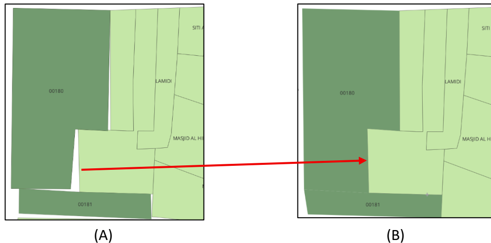
Gambar 2. Bidang Tanah Sebelum (A) dan Setelah (B) Block Adjustment

Koordinat pergeseran arah sebelum dan setelah pengolahan Block Adjustment dapat dijadikan sebagai lampiran dalam berita acara kegiatan peningkatan kualitas data spasial bidang tanah terpetakan di lokasi PTSL. Daftar koordinat dapat dijadikan sebagai metadata riwayat perubahan data spasial yang memungkinkan untuk menelusuri kembali apabila di kemudian hari terdapat sanggahan terhadap permasalahan yang muncul akibat pergeseran batas bidang tanah dalam proses penataan batas bidang tanah.