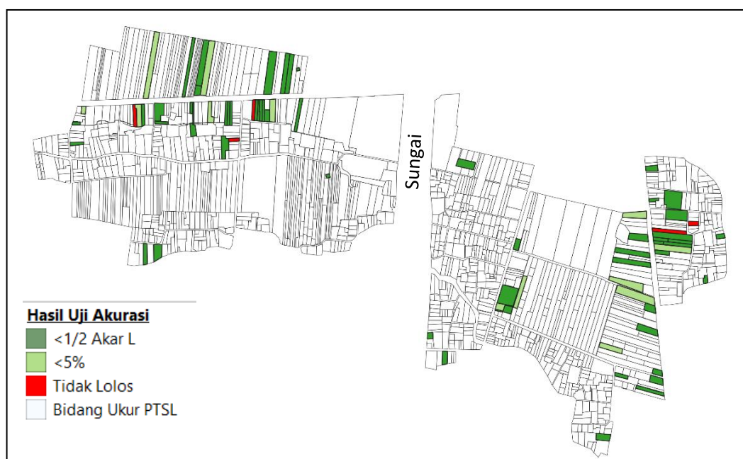
Gambar 5. Hasil Uji Akurasi Luas Desa Suwaru.

itu, uji Z dapat digunakan untuk menilai signifikansi perbedaan luas antara hasil Block Adjustment dan pengukuran lapangan.